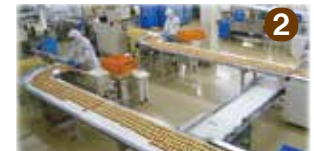
② ラスクの選別~包装