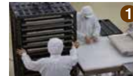
① パケット製造~ラスクへのスライス